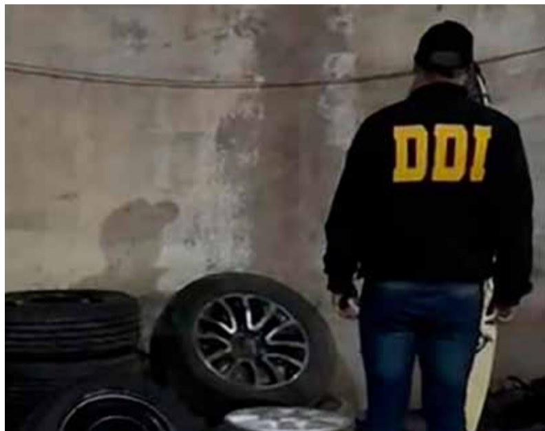
Allanamientos en Necochea por robos de ruedas de auxilio. - Ecos Diarios -

Así se logró determinar el lugar donde se situaba el galpón en el que los delincuentes acopiaban y ocultaban los objetos sustraídos, para su posterior venta en el mercado negro. Orden judicial mediante, irrumpieron en un galpón de la calle 22 al 3000, de Neco-