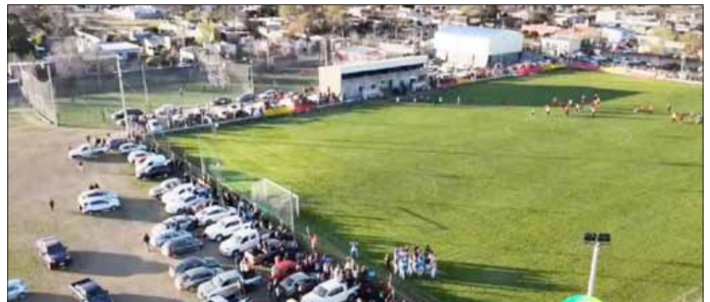
Postales que dejó la segunda y decisiva final entre Bull Dog y Balonpié, en la cancha del conjunto deroense. Camaradería entre los jugadores e importante marco de público, todo lo que se esperaba de la definición del torneo local.

Quinta fecha Balonpié vs. Bull Dog. Bancario vs. Casariego. Guglieri vs. Atlético Urdampilleta. Independiente vs. Empleados de Comercio.