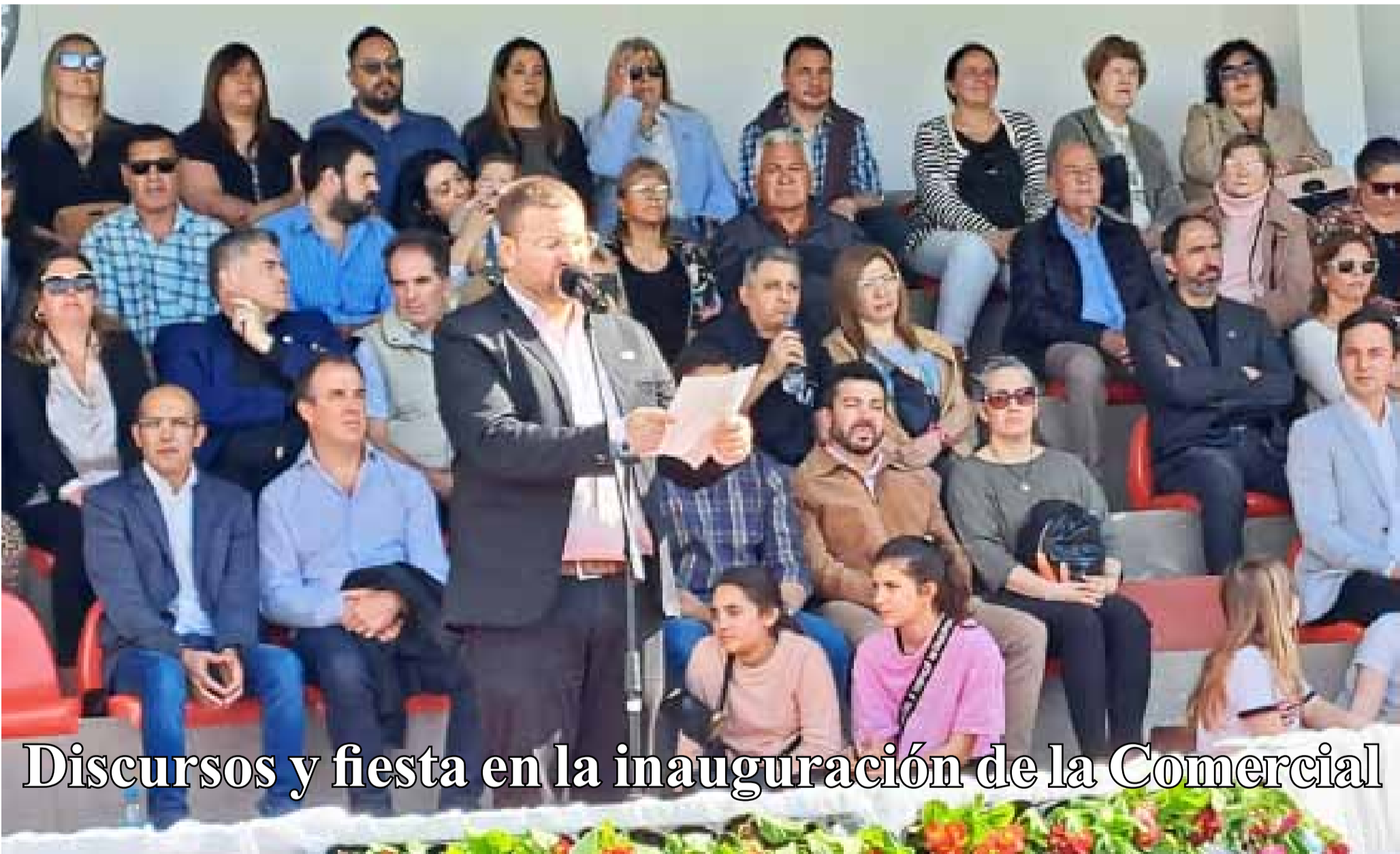
Discursos y fiesta en la inauguración de la Comercial