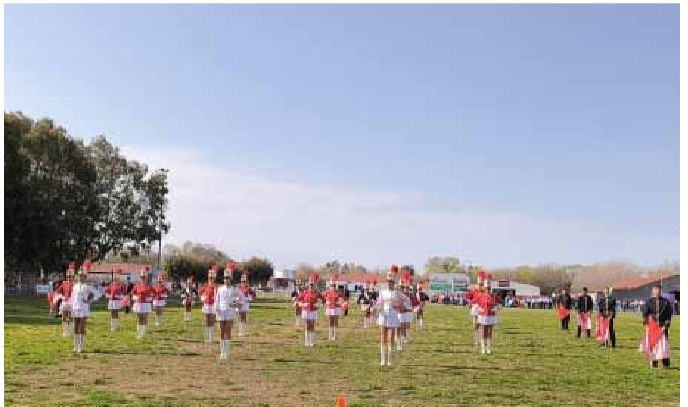
LA GUARDIA DEL MAR VOLVIÓ A DESFILAR EN BOLÍVAR