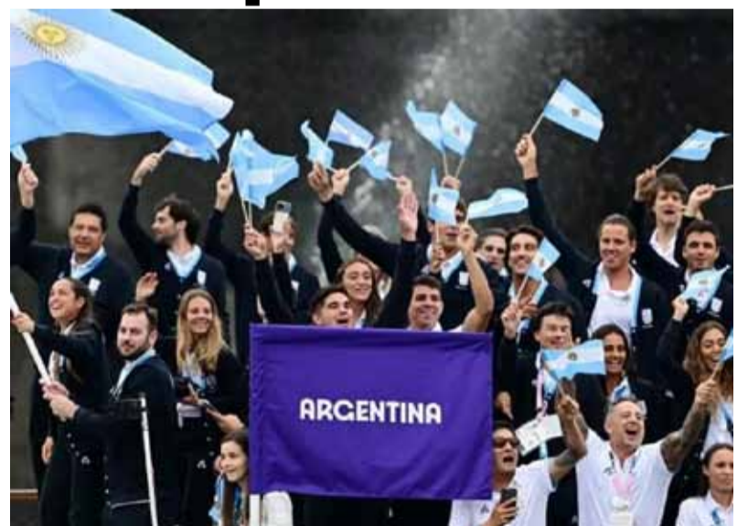
Delegación argentina en París 2024.

Además, con la participación de 168 delegaciones y casi 2,000 mu-