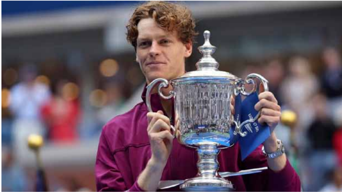
Jannik Sinner ganó por primera vez el US Open

El italiano, número 1 del mundo, dejó atrás el escándalo por el caso de doping y logró llevarse el último Grand Slam del año ante el local, que no pudo dar el batacazo frente a su público.