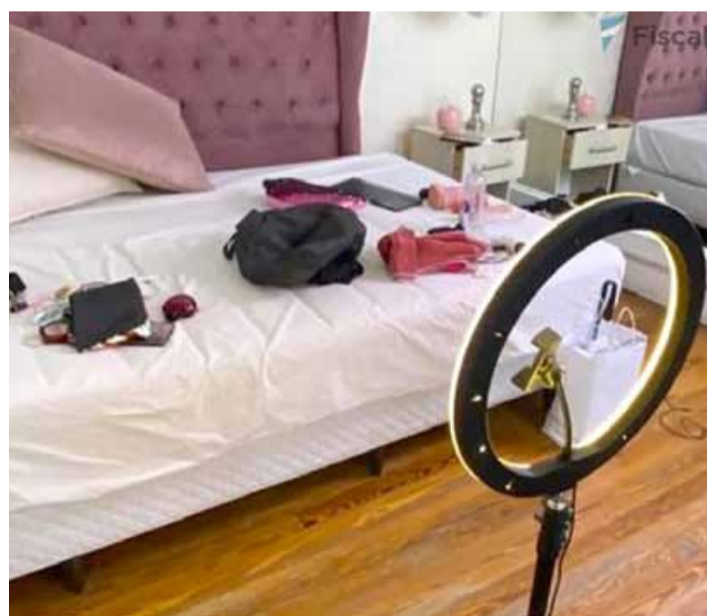
Explotación Sexual en Entornos Digitales. - Fiscales -

La explotación sexual es el tipo de delito denunciado en la mayor cantidad de casos desde 2015 de manera estable, mientras que la explotación laboral se configura en un segundo lugar desde 2019. Antes de ese año, ese lugar lo ocupaba la búsqueda de personas. Desde entonces el tercer lugar lo ocupan las denuncias vinculadas a la posible captación y oferta laboral engañosa, mientras que en cuarto lugar se observan las denuncias relacionadas con la desaparición de personas.